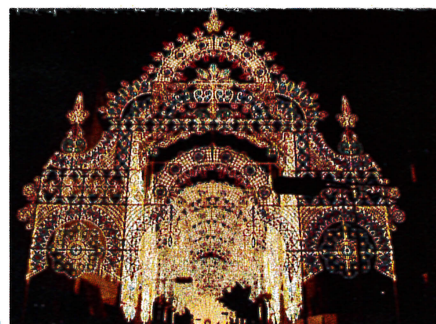
神戸ルミナリエ (神戸市) 毎年12月に阪神淡路大震災で犠牲となった人々の鎮魂と追悼を目的として催される祭典。 2010年は12月2日～13日。 通りや広場が幾何学模様のイルミネーションで彩られ光の回廊を演出している。

私が通っていた幼稚園は、毎日お弁当でしたが、先生にお弁当をきれいに食べたか見せるように言われていました。お百姓さんが、八十八日手間ひまかけて作ってくださるのだから、一粒も残さないようにと、お箸で一粒一粒つまんで食べたことを覚えています。