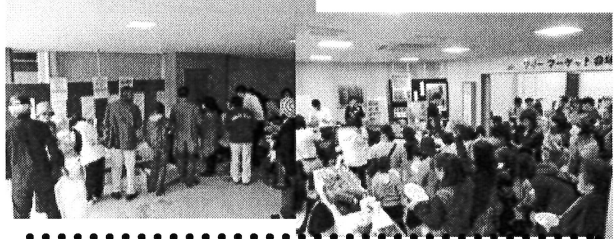
第8回フリーマーケットは3月6日開催予定です

10月31日に花みずき会館にて第7回フリーマーケットを開催致しました。当日は途中から、あいにくの雨でしたが、多数の方がお越し頂いて楽しんでおられました。今回は、泉州のまごころ栽培農園さん直送の有機野菜・東淀川区小松のチャンピオン餃子さんの冷凍餃子・東淀川区豊新の九条さんのチヂミ・東淀川区南江口hana cafeさんからは、ふわふわのバームクーヘン・吹田市東御旅町のシネマコレクションさんのキャラクターグッズ等、地域の店舗の皆様にも御協力を頂きました。御出店・御協力いただいた方々、並びに御来場いただいた方々、本当にありがとうございました。